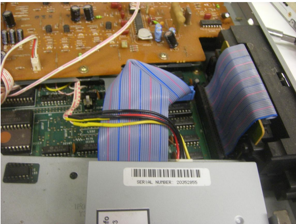
De 34-aderige kabel met 180° draaiing en de verlengde voedingskabel.