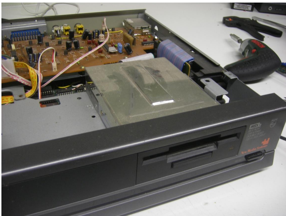
De Philips NMS 8250 computer met originele diskdrive.