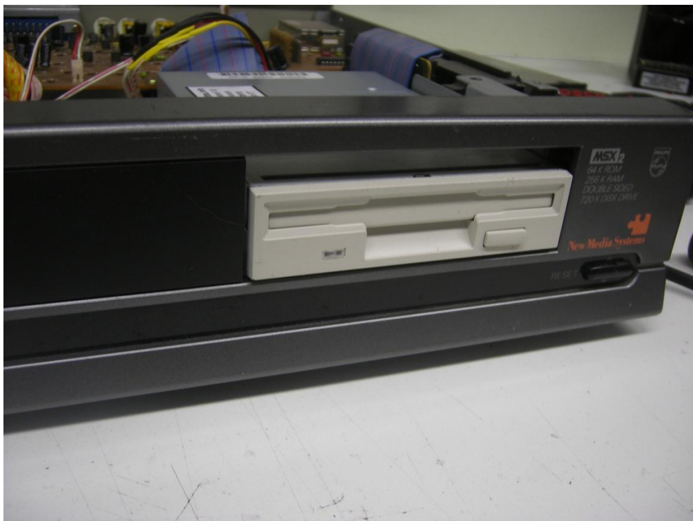
De Philips NMS 8250 met een nieuwe diskdrive.