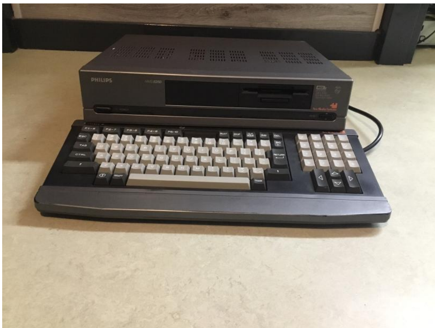
De Philips NMS 8250 MSX-2 computer.

Het vervangen van de originele diskdrive door een nieuwe diskdrive is erg eenvoudig. De vervangende diskdrive is 7 mm lager dan de originele diskdrive. Voor deze beschrijving is een Philips NMS 8250 gebruikt en een nieuwe diskdrive met een wit frontje, maar natuurlijk is het veel mooier om een diskdrive met zwart frontje te gebruiken. Deze beschrijving kan ook worden gebruikt voor de Philips NMS 8255 en de Philips NMS 8280 computers en voor het inbouwen of vervangen van een tweede diskdrive.