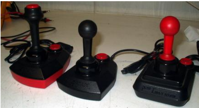
Verschillende Arcade joysticks.

Er zijn diverse soorten Arcade joysticks van Suzo. Voor de MSX-computer zijn dit de beste joysticks en dan met name de versies met twee onafhankelijke vuurknoppen. Maar na vele uren speelplezier kan het gebeuren dat zelfs deze joysticks niet meer goed werken. Gelukkig zijn ze eenvoudig te repareren.