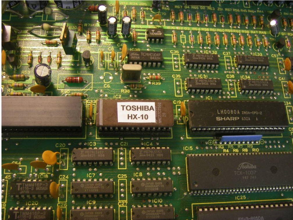
De Systeem-ROM is vervangen (IC2)

Vervang de Systeem-ROM (IC-2) of vervang de LVA510, PAL-Encoder (deze zit op de kleine printplaat aan de linkerzijde).